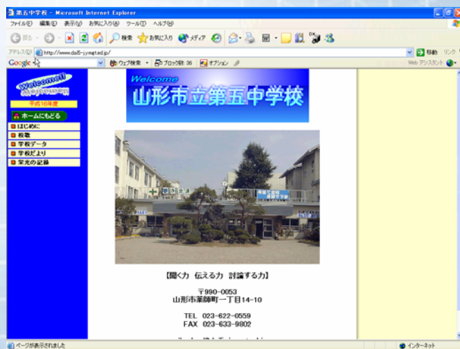
外部用として公開している本校ホームページの画面