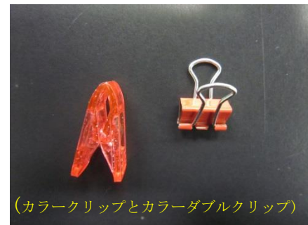
(カラークリップとカラーダブルクリップ)

また、カラークリップでかざりをつけていくので、つける位置の移動が容易にできます。