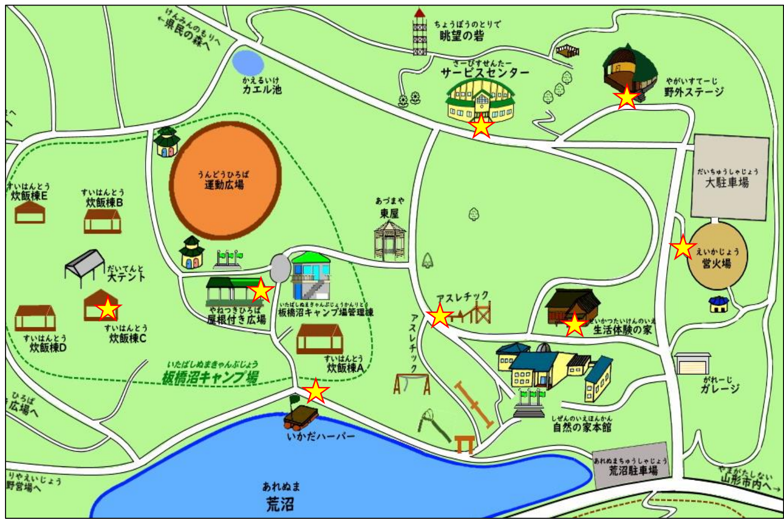
せいかつたいけん いえ 生活体験の家